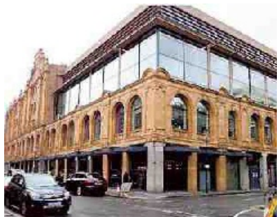
L'edificio di Sloane avenue

zare nel giro di una settimana. Peña Parra vuole vederci chiaro. Chiede la documentazione e scopre – prima sorpresa – che Perlasca ha già firmato, lo stesso 22 novembre, due contratti, un “Framework Agreement” e uno “Share Purchase Agreement”, con la società Gutt Sa di Torzi. I dubbi del nuovo Sostituto si infittiscono. Prende carta e penna e invia ai sottoposti una lunga serie di obiezioni su entrambi i contratti.