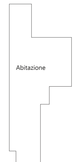
Vasca coperta STO 03